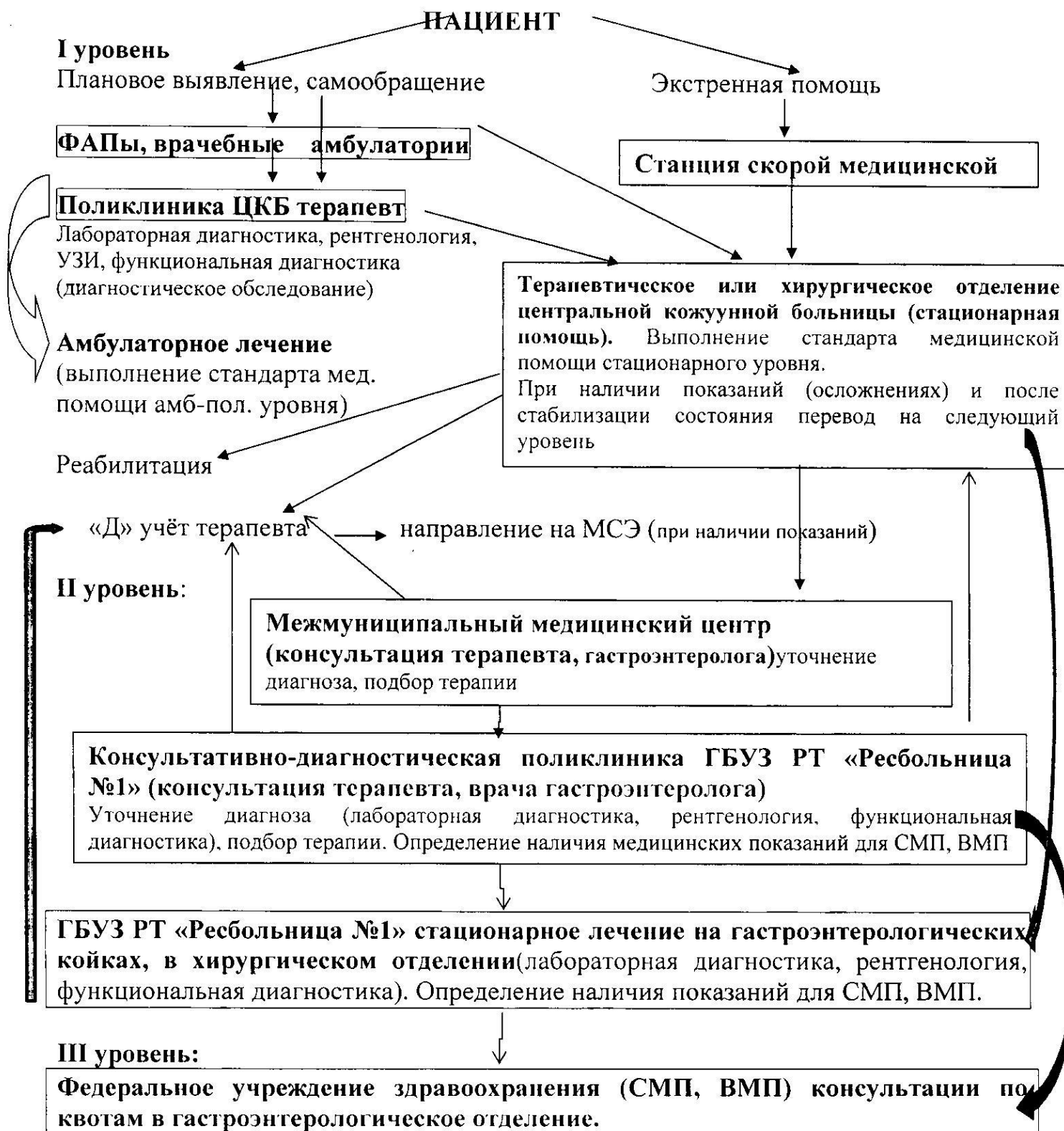
Схема маршрутизации пациента при оказании медицинской помощи по профилю «гастроэнтерология»