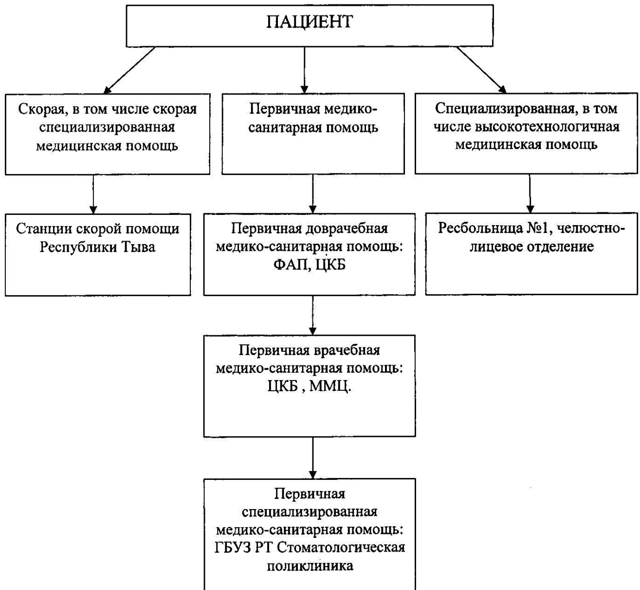
Схема маршрутизации взрослого населения при стоматологических заболеваниях на территории Республики Тыва